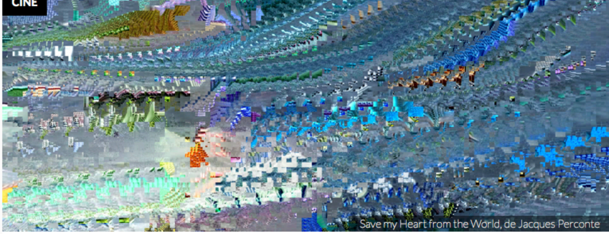
Save my Heart from the World, de Jacques Perconte