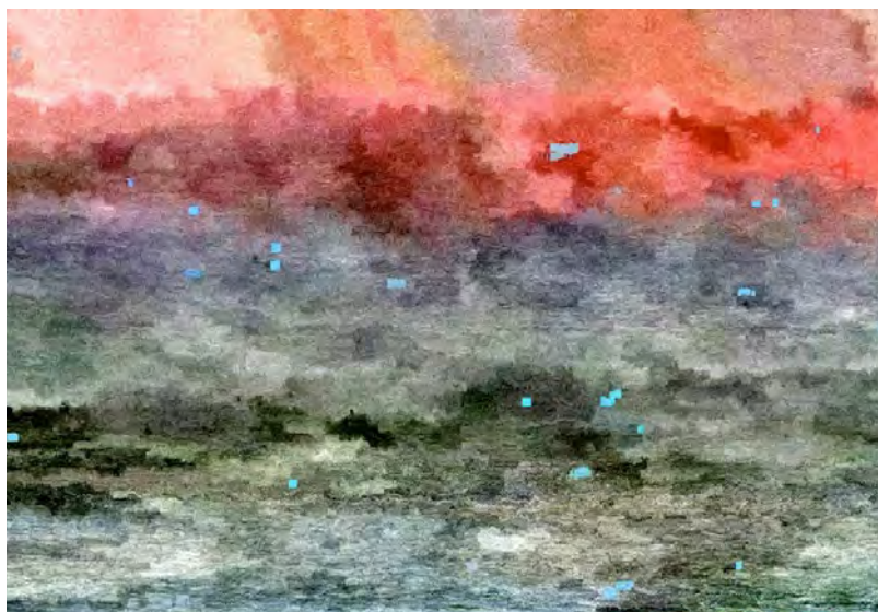
► Jacques Perconte, Marines , Capture d'écran.

Il importe de souligner que, si l'algorithme mis en place par Jacques Peconte pour I Love You produit des images souvent arides et inconfortables, l'artiste a su trouver une touche proprement picturale dans son travail, qui est particulièrement sensible dans ses séries d'impressions d'images fixes réalisées à partir de flux vidéo. Ces derniers sont soumis à des algorithmes de compression qui opèrent sur la matière des images, mais dans une perspective où il s'agit, à la différence du pur lâcher-prise qui est à l'œuvre dans I Love You , de produire des altérations visuelles désirées et d'une certaine façon contrôlées, pour porter les images à une dimension plastique tout à fait sidérante. C'est ainsi que Tempête à Vielle-Saint-Girons [12] par exemple, ou encore la série des Marines [13], dont le titre, qui est un motif en soi, dit bien la dimension picturale, se fraient