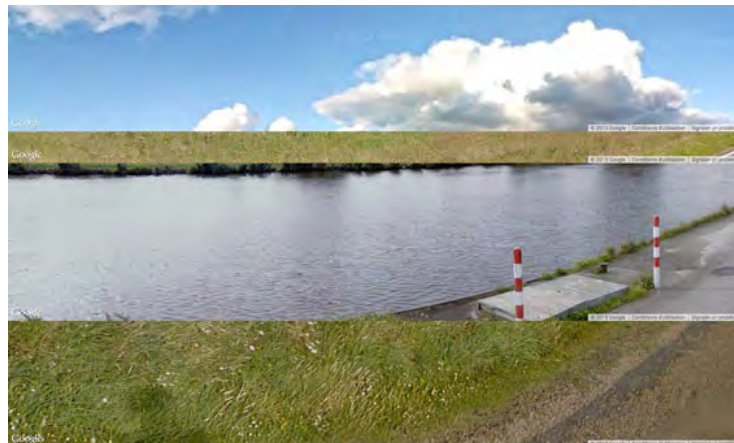
› Julien Levesque, Street Views Patchwork , capture d'écran.

Certaines pratiques contemporaines se saisissent des images constituées par Google dans sa volonté de photographier le monde, images que l'on qualifiera volontiers d'images non-photographiques, dans la mesure où elles cherchent précisément à annuler ou à nier la puissance d'arrêt de la photographie. Si le propre du flux computationnel est de faire disparaître immédiatement les images qu'il accueille pour nous inviter à nous mettre en présence d'autres images, ce qui est le principe même de la navigation sur Google Street View , l'artiste ne pourra faire face qu'en y introduisant des facteurs à même de le rendre inopérant : en le disloquant d'une certaine manière, ou en recherchant à l'intérieur de l'image elle-même un motif de suspension ou de stupéfaction. Deux artistes contemporains, Julien Levesque d'une part, et Jon Rafman de l'autre, dans des travaux formellement assez différents, mais qui puisent à la même source, s'efforcent en ce sens d'exploiter la cartographie mondiale composée par Google pour donner accès à un état poétique – et critique s'agissant de Jon Rafman – du monde, que la vaste entreprise développée par Google Street View veut précisément ignorer.