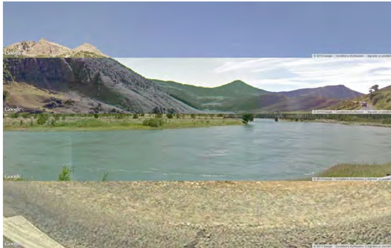
› Julien Levesque, Street Views Patchwork , capture d'écran. Avec l'aimable autorisation de l'artiste.